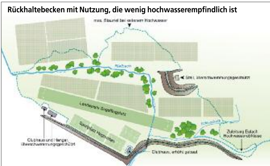
Das geplante Hochwasserrückhaltebecken Winterthur mit Sportanlage und Segelflugplatz.