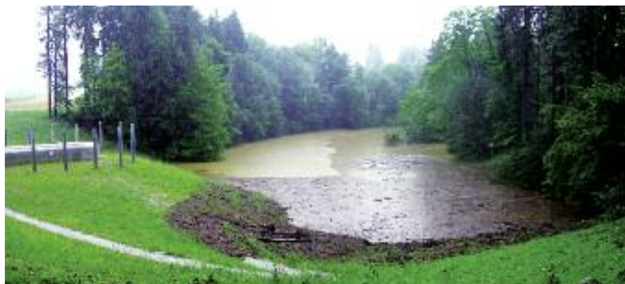
Hochwasser im August 2007: Dank des kurz vorher eingeweihten Rückhaltebeckens Jonenbach blieb Affoltern am Albis verschont. Der maximale Wasserstand während der vergangenen Nacht ist anhand der Ablagerungen deutlich sichtbar.

Erfahrungsgemäss wird ein Grossteil des Rückhaltebecken-Geländes nur alle 10 bis 20 Jahre für wenige Stunden beansprucht. Dieser Platz steht somit für Hochwasser-unempfindliche Nutzungen zur Verfügung wie beispielsweise Sportanlagen (Becken Marthalen, Winterthur), Landwirtschaft (die meisten Becken), Segelflugplatz (geplantes Becken Winterthur). Die dazugehörigen – empfindlicheren – Infrastrukturen wie Gardenroben, Clubhäuser oder Hangaranlagen werden dabei durch Objektschutzmassnahmen wie Dämme oder erhöhten Bau vor Überschwemmungen geschützt. Der unterste Bereich der Becken aber, welcher bei kleineren Hochwassern regelmässiger betroffen ist, wird in der Regel als reiner Naturbereich gestaltet.