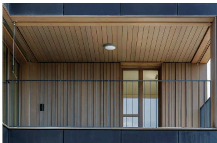
Detail einer in das Gebäudevolumen eingeschobene Loggia - mit Holz ausgekleidet sorgen diese für eine wohnliche Atmosphäre.