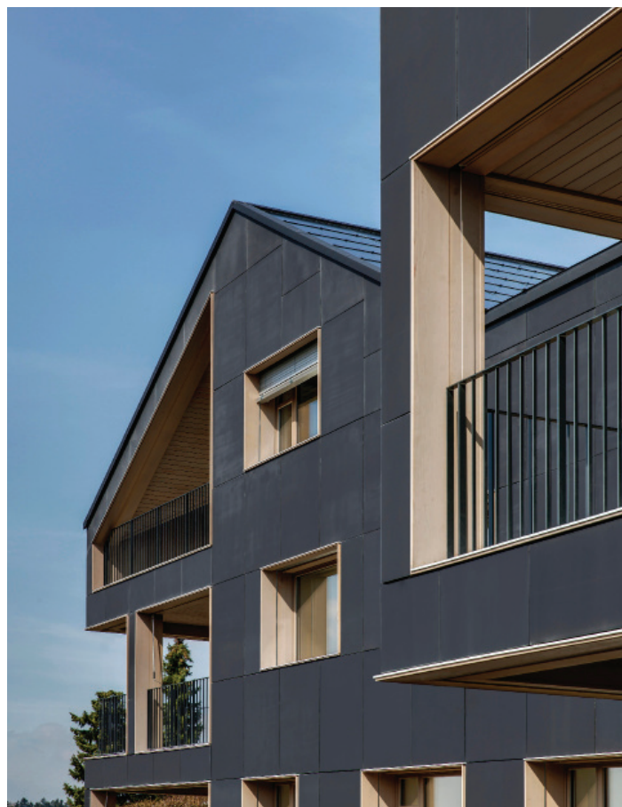
Fassadendetail mit eingeschobenen Loggien und Fensteröffnungen – die gesamte Gebäudehaut liefert Solarstrom und sorgt mit den in Holz ausgekleideten Loggien und Fensterleibungen für eine elegante Architektursprache.

Die Wirtschaftlichkeit einer PV-Fassade hängt von zwei Faktoren ab: von den Kosten für die Fassade und vom Wirkungsgrad der PV-Module im Betrieb. Um die Kosten niedrig zu halten, setzte man auf vorhandene Standardprodukte, die zu neuen und sehr effizienten Lösungen kombiniert wurden. Die Gesamtkosten der neuartigen PV-Fassade inklusive aller Montage- und Installationskosten liegen bei rund 540 €/m 2 – und damit tiefer als der Durchschnittspreis einer Glasfassade. Deshalb wurden auch auf der Nordseite des Hauses PV-Module und keine optisch angepasste Glasfassade verwendet.