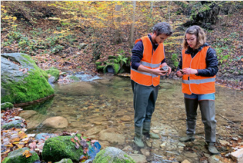
Fig. 3 Beurteilung des Zustandes der Einleitstelle im Feld aufgrund des äusseren Aspekts.