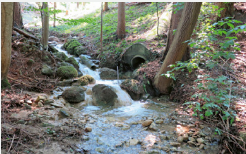
Fig. 2 Beispiel einer Einleitstelle im Einzugsgebiet des Abwasserverbandes.